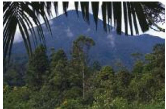
Jardín Botánico de Cibodas y vegetación de sus alrededores (Kemal Jufri)