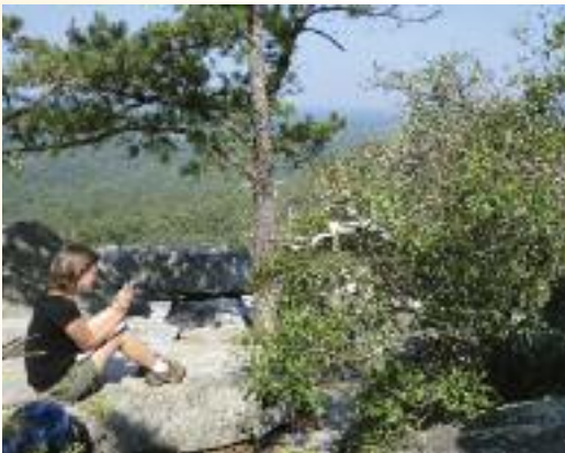
Colección de datos de campo de Quercus georgiana . (A. Kramer)

Para abordar este problema, BGCI de Estados Unidos ha emprendido un proyecto conjunto con el Servicio forestal estadounidense, el parque zoológico de Cincinnati, el jardín botánico del Center for Research of Endangered Wildlife y el programa de posgrado de Longwood, para investigar la conservación de las colecciones vivas actuales de cuatro especies amenazadas de robles. El proyecto incluye también investigaciones para mejorar las opciones de conservación ex situ de las especies objeto de estudio y de otros robles amenazados en todo el mundo. Las especies elegidas han sido: Q. acerifolia (En peligro), Q. arkansana ("Vulnerable"), Q. boyntonii ("Críticamente amenazada") y Q. georgiana ("En peligro"). Entre otros factores de riesgo, la supervivencia de estas especies se ve cada vez más amenazada por una combinación de presiones relacionadas con el cambio climático y con la propagación de la enfermedad conocida como "muerte súbita del roble" ( Phytophthora ramorum ), lo que convierte a las colecciones ex situ en una prioridad esencial en términos de conservación.