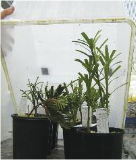
Arriba: Cortes de coníferas en un contenedor cerrado en el Real Jardín Botánico de Tasmania (RTBG).

Derecha: Flor de Magnolia yarumalensis . (A. Cogollo)