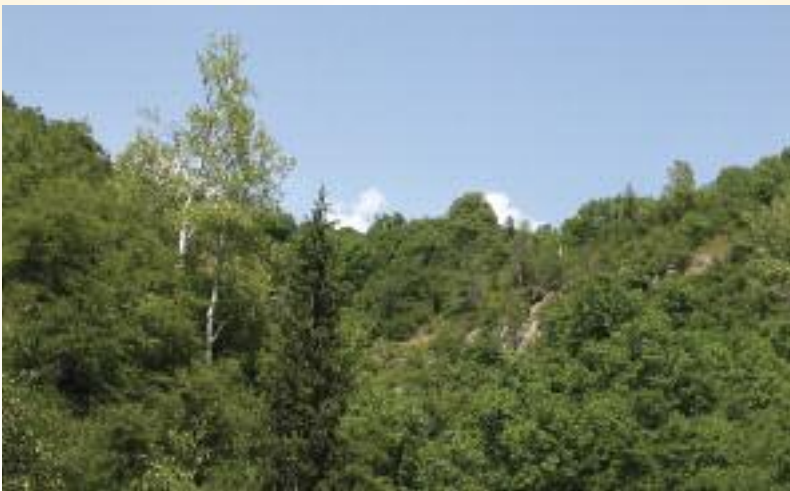
Bosque de nogal en Kirguistán. (J. Gratzfeld)

Como parte de un proyecto altamente interdisciplinario financiado por el Instituto Darwin de Reino Unido entre 2009 y 2012, BGCI ha estado trabajando con el Jardín Botánico de Gareev, de la Academia nacional de las ciencias de la República de Kirguistán, para desarrollar campañas de divulgación. Estas se centran en la importancia de proteger las especies kirguisas de árboles frutales y de núculas, así como los ecosistemas de los que forman parte. A través de las actividades de Fauna & Flora International y de varios colaboradores kirguisos, se han empezado a hacer esfuerzos para mejorar la conservación ex situ de especies de árboles frutales y de núculas, así como para preparar su potencial reintroducción en áreas silvestres.