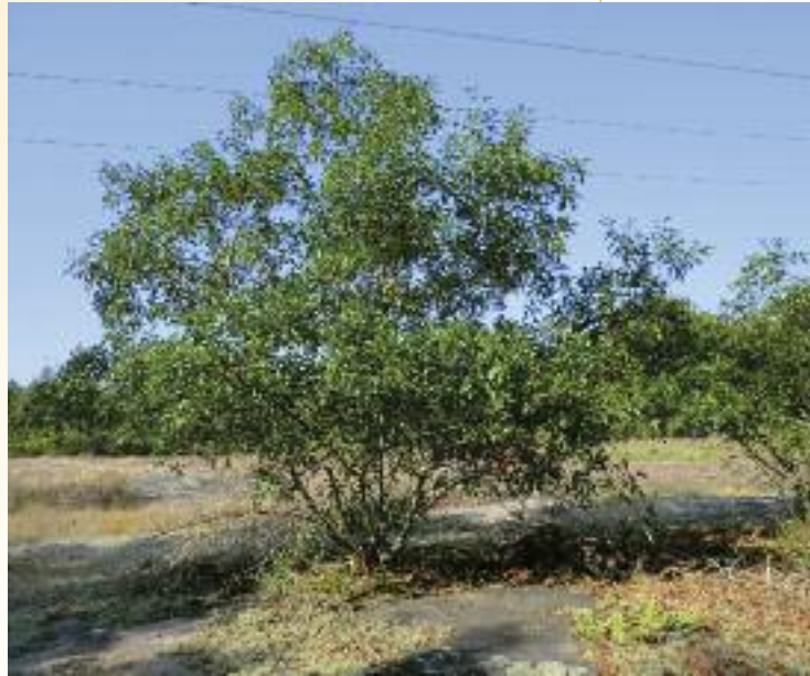
Quercus georgiana . (A. Kramer)

Los miembros del proyecto trabajan con aquellos jardines botánicos y arboretos que mantienen colecciones vivas de estas especies en Estados Unidos, para llevar a cabo estudios genéticos y ensayos de micropropagación. Se ha recurrido a la base de datos de BGCI PlantSearch para localizar dichas colecciones ex situ . Los objetivos del proyecto consisten: