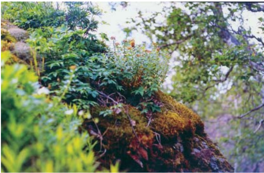
Рис. 3. Местообитание низкогорной (тенево́й) формы родиолы иредмельской