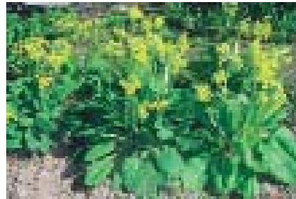
Рис. 14. Маточные растения первоцвета весеннего — Primula veris L. в питомнике