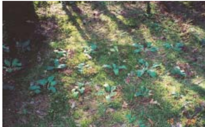
Рис. 15. Взрослые особи первоцвета весеннего в опыте реинтродукции