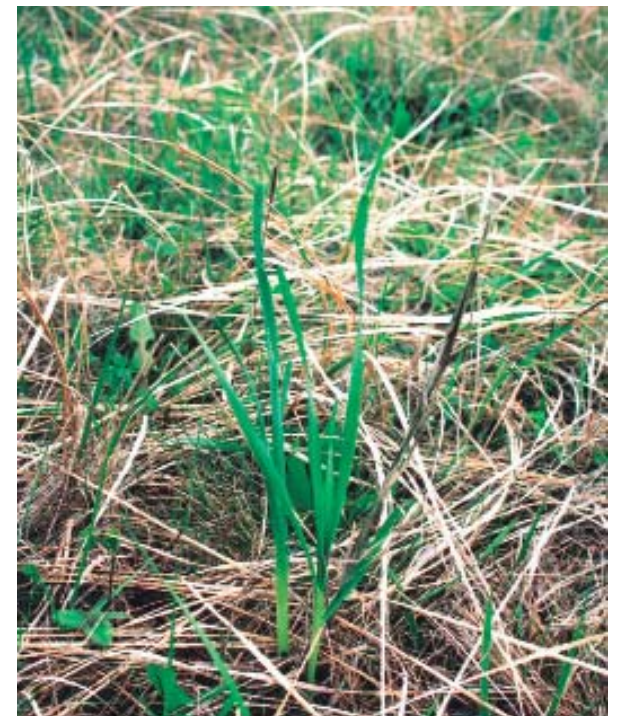
Рис. 9. Растение лука плевкорневищного через 2 года после посадки