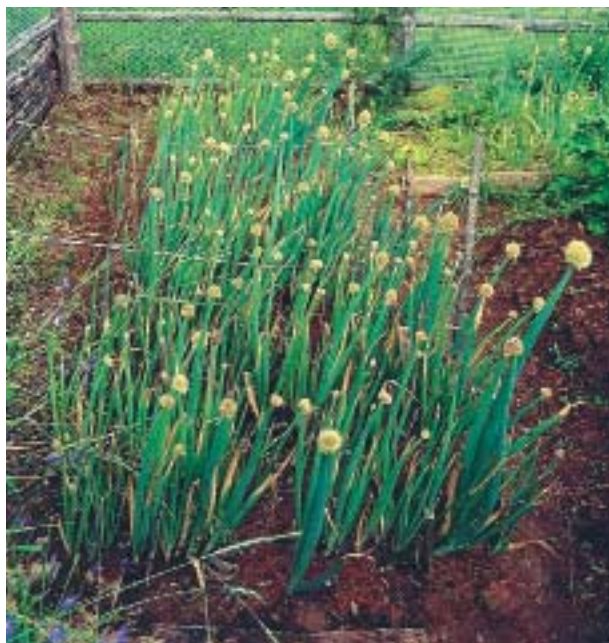
Рис. 11. Маточная плантация лука на грядке около базы Б-ЛГЗ на западном побережье оз. Байкал