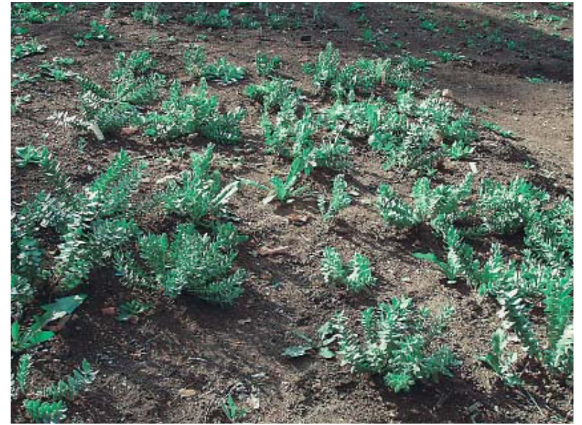
Рис. 4. Интродукционный питомник низкогорной (тенево́й) формы родиолы иредмельской Rhodiola iredmelskaya A. Boriss