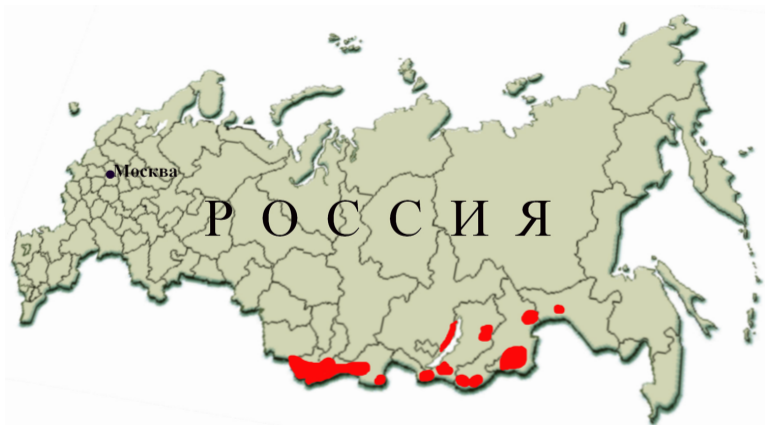
Рис. 10. Ареал распространения лука алтайского Allium altaicum Pall. (по Красной Книге РФ)