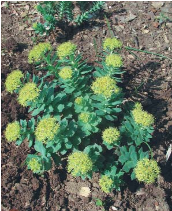
Рис. 2. Родиола иредмельская — Rhodiola iredmelskaya A. Boriss. во время цветения