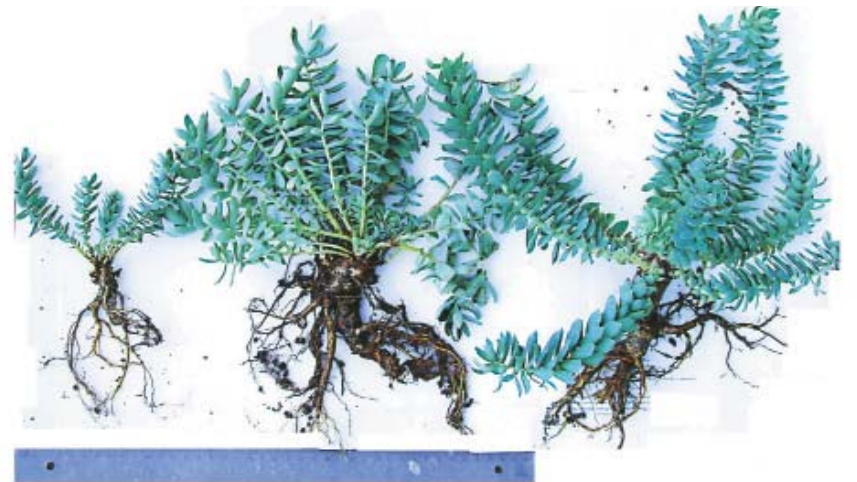
Рис. 5. Выращенный в питомнике посадочный материал родиолы иредмельской