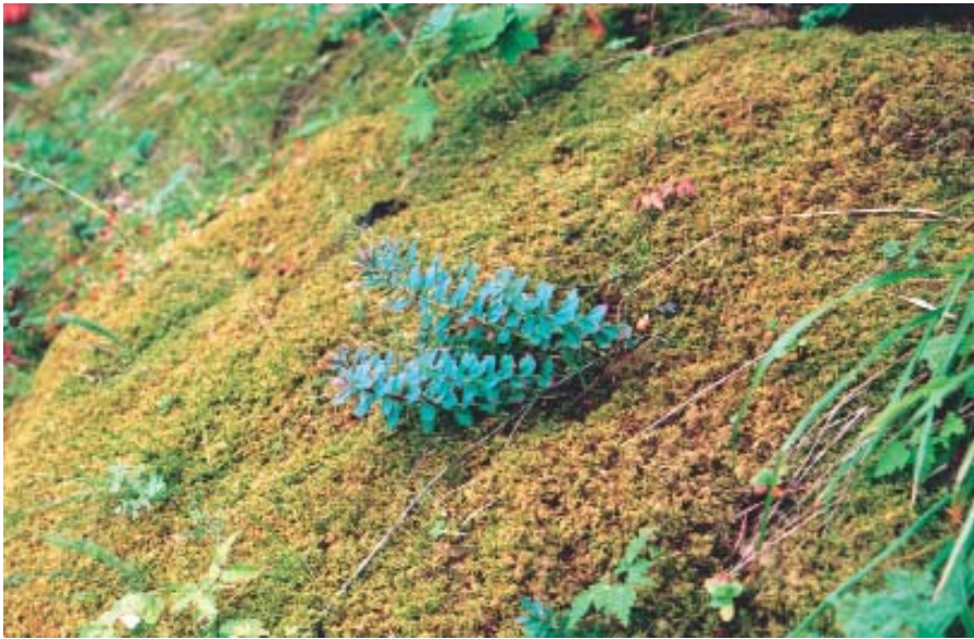
Рис. 6. Растение родиолы ирмельской через год после посадки