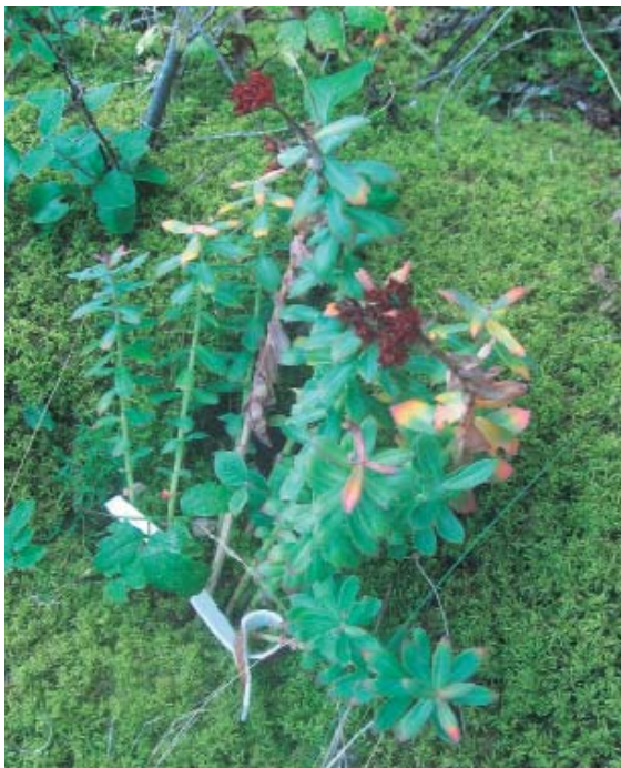
Рис. 7. Плодоносящее растение родиолы ирмельской через 2 года после посадки