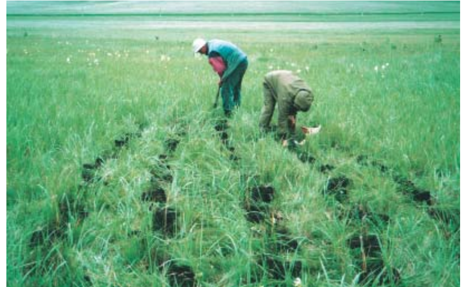
Рис. 8. Посадка лука плевкорневищного — Allium humenorrhizum Ledeb. в природные местообитания