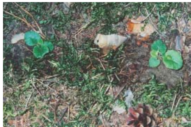
Рис. 16. Молодые особи первоцвета весеннего в опыте реинтродукции