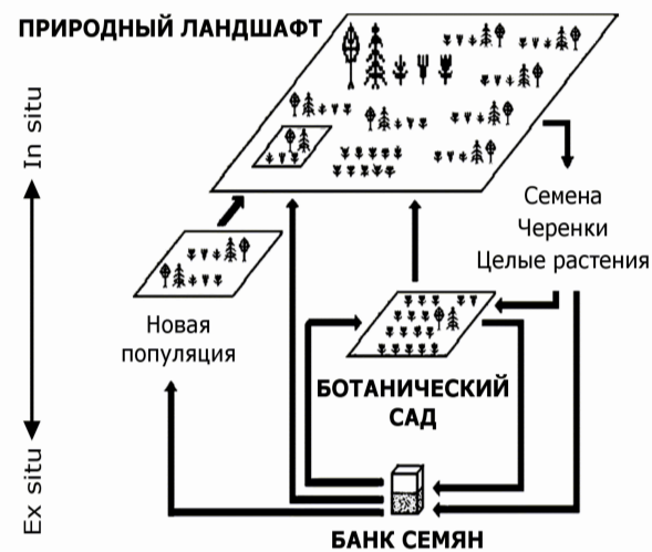
Рис. 13. Позиционирование ботанического сада в системе циркуляции генетических ресурсов растений для интродукции, сохранения in situ и ex situ , а также для восстановления нарушенных популяций [Кузеванов, Сизых, 2005; Kuzevanov, Sizykh, 2006]